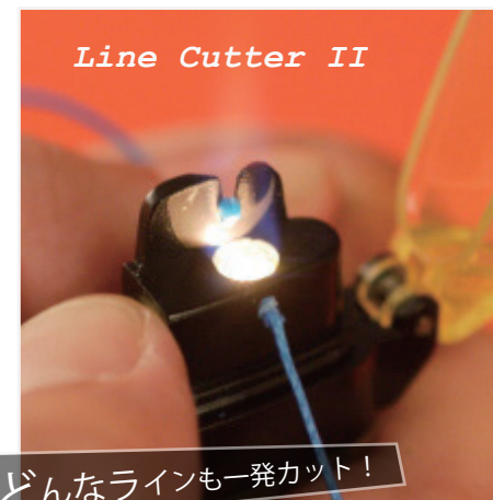
どんなラインも一発カット! ラインカッターII