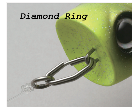
世界最強! ダイヤモンド型スプリットリング! ダイヤモンドリング