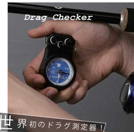
世界初のドラグ測定器! ドラグチェッカー

SYNESTHESIA AJ-59ST "Short Solid Tip Model" 5'9" 0.1-4g PE#0.1-0.5 ¥32,800 SYNESTHESIA AJ-610TT "Tubular Tip Model" 6'10" 0.1-15g PE#0.1-0.6 ¥36,800