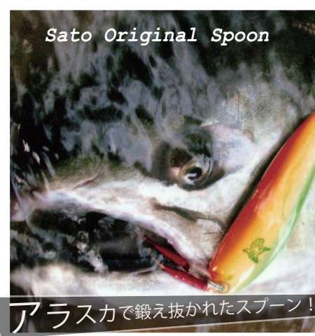
アラスカで鍛え抜かれたスプーン! サトウオリジナル スプーン