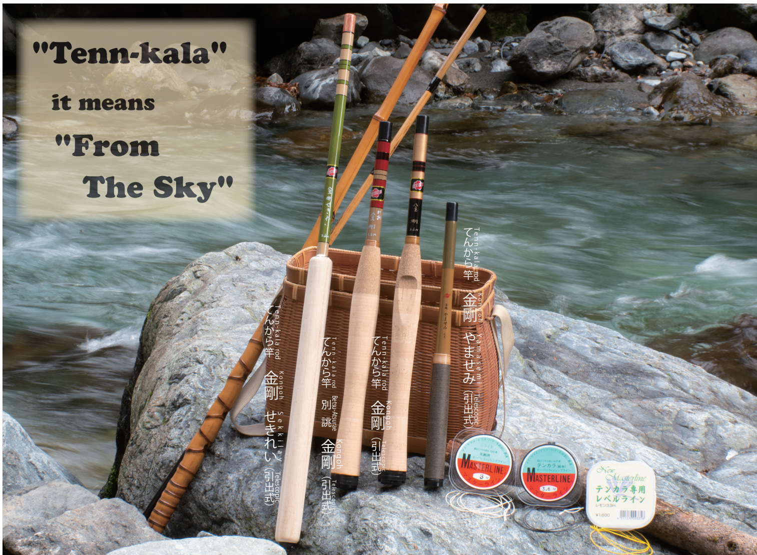
Kongoh Betsu-Atsurae Kongoh てんから竿 金剛 // 別 誂 金剛