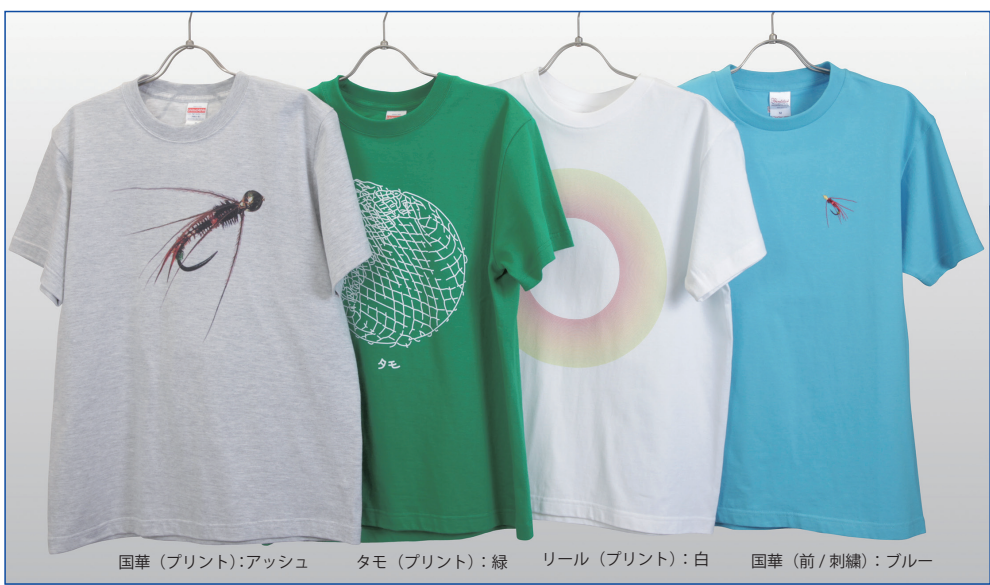
国華 (プリント):アッシュ タモ (プリント):緑 リール (プリント):白 国華 (前/刺繍):ブルー