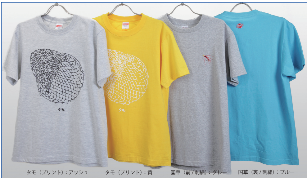
タモ (プリント):アッシュ タモ (プリント):黄 国華 (前/刺繍):グレー 国華 (裏/刺繍):ブルー

「釣場だけではなく、街中でも着れるものを」とデザイナーの方にお伝えして、オリジナルのTシャツをデザインして頂きました。プリント、刺繍タイプ共に、バックサイドのトップにサクラロゴが入っております。「鮎毛鉤 国華」は、初代 江戸川 櫻井 信太郎考案による「国華鮎毛鉤シリーズ」をモチーフとしております。このほか、「タモ」と「リールのスプール」をイメージした2点を、ご用意致しました。