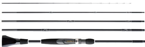
・大型射当て付 別誂 金剛 夕なぎ 弐ヨング 弐キウゴ 弐四伍 / 弐九伍 Ninja Master

「どうしても目方が嵩む。手間が要る。調子が出しにくい。良い調子に仕立てるには、並外れた腕と、良い（高価な）素材が不可欠。」継竿登場 300 年来、この小継竿の「宿命」に立ち向かった名工が、何人も存在しました。二代目 江戸川 櫻井 博も若い時分から、小継竿を得意とし、畑違いの「洋物」の小継六角リール竿に強い関心を寄せておりました。終戦後、二代目は、「トラベラーズ・ロッド」と呼ばれた小継の竹製六角竿のフライ・スピル兼用竿を試作し、時をおかず、米軍 PX への大量納入を果たしたのです。焼跡のバラックで、家内制手工業の体でつくられた小継竿は、「帰郷米兵にもっとも好まれる日本土産品」として飛ぶように売れ、今日のサクラの礎を築いてくれたのです。その後も二代目は小継竿づくりに励み、冒頭の「宿命」に挑み続け、たなご竿などはごくあたり前として、始終には小継トローリング・ロッドまで製作したのです。さて、今日ですが、グラス材、カーボン材は、ともに未だ進化の歩みを止めず、年毎に秀れた、新型素材が登場しているほどです。このような素材の素晴らしさに助けて貰い、「宿命」を覆して、良い小継竿が作れるようになりました。小継竿は古くより携帯用竿、旅行者用竿として、多くの釣人に愛されて来たのです。