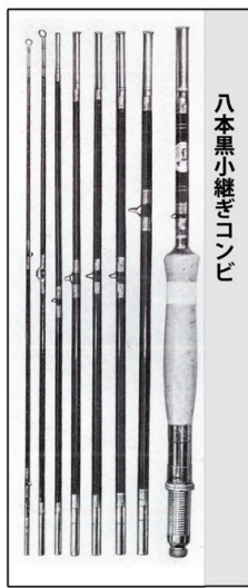
弊社'60年代のカタログより