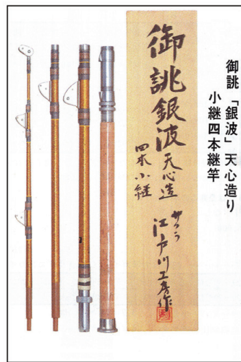
弊社'70年代のカタログより