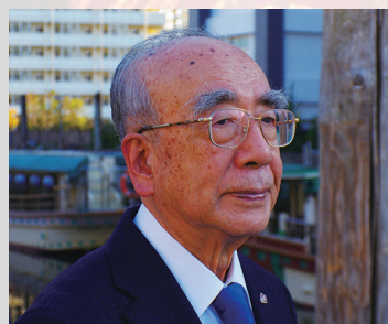
釣船橋にて（深川 富士見 乗船場）

“釣りを楽しみ世界を平和に” “World Peace by Fishing” “釣魚助力世界和平”